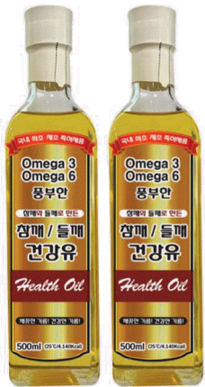
대용량 (500ml X 2병)

대한민국 최초로 유일하게 들깨 식용유를 제작한 청담 참깨/들깨 혼합 건강유는 몸에 좋은 들깨와 참깨를 엄선하여 추출하고 정제하는 과정을 통해 만들었기 때문에 깨끗하고 신선한 기름을 맛보실 수 있다. 오메가3와 오메가6가 풍부한 참깨/들깨 혼합 건강유는 상호 간에 좋은 영향을 주기에 균형 있게 섭취해야하는 영양소이다. 최적의 비율로 담아 영양은 물론 건강까지 동시에 챙길 수 있다. 건강유는 필수지방산은 요리로 만들 수 없습니다. 인체에서 합성할 수 없어 음식이나 건강보조식품으로 섭취 해야 하는 필수지방산이 풍부하다. 청담 참깨/들깨 건강유를 이용하여 일상생활의 요리로 맛있게 건강하게 섭취할 수 있다. 들깨와 참깨로 만든 건강유는 기존 시중에 유통되는 일반 들기름과 참기름은 풍미를 더해 주는 조미유로서 그 용도가 제한적인 반면 청담 참깨/들깨 건강유는 샐러드용은 물론 튀김 및 부침 등 조리용으로 건강하고 요리가 가능하다. 이미 이취가 없는 깨끗한 맛과 향으로 참깨와 들깨 특유의 강한 대시 깨끗한 맛과 향을 살려 누구나 편하게 즐길 수 있다. 청담 들깨 식용유는 몸에 좋은 들깨와 참깨를 엄선하여 추출하고 정제하는 과정을 통해 만들었기 때문에 깨끗하고 신선한 기름을 맛보실 수 있다. 정제를 통해 불순물을 제거하여 기존의 들기름보다 더 길어진 유통기한으로 더 안전하고 간편하게 보관이 가능하다. 국내최초 특허받은 공법인 에스알지 (SRG)가 보유한 기술력은 오일제조장치 및 이를 이용하여 기능성 유지를 제조하는 공법으로 만들었다. 자세한 사항은 www.더드림365.com 또는 전화 1800-6639 로 문의 하시면 된다. 입금계좌(농협)301-0236-7453-61 (주)더드림홍쇼퍼 이고 택배비 4,000원 소비자 부담이다.