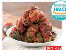
여수 돌산 갓김치

여수돌산갓김치 4kg + 고들빼기 1kg 총 5kg 59,800원 고들빼기 4kg + 여수돌산갓김치 1kg 총 5kg 79,800원