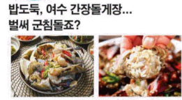
밥도둑, 여수 간장돌게장... 벌써 군침돋죠?

돌게는 꽃게와 같은 효능이 있으므로 음기를 더하고 수액을 보하며, 열을 식히고 피를 잘 돌게 합니다. 습사를 물리치고 쪼기를 삭이며 독을 없앱니다. 경락을 소통시켜 뭉친 이혈을 풀어주고 근육과 뼈를 잘 돌게 합니다. 돌게는 찬바다에서 잡을수록 달고 단단해 제장을 해도 살이 흘러 내리지 않아 오로도록 본연의 맛을 느낄 수 있습니다. 여수간장 돌게장 비법소스의 발효독 최장자입니다. 깊고 진한 맛과 마음을 담은 간장돌게장은 100% 핸드메이드로 정성을 담았습니다. 최고 품질의 재료들과 거품을 뺀 정직한 가격으로 고객님 한번 본연의 참맛을 한 마음을 담아 정성어린 진심을 전하고 있습니다. 제장 특유의 비린내 제거를 위해 꼼꼼한 세척과정을 거쳐 깔끔한 감칠맛만 남습니다. 10여가지의 국내산 재료만을 사용하여 오랜 시간 끓여낸 간장은 돌게의 감칠맛을 만나 더 깊고 풍부한 맛을 냅니다. 여수 간장 돌게장은 비법소스에 담겨 보온 급냉하여 2.5kg 단위로 평균 약15마리 내외의 돌게가 들어있습니다. 여수 간장돌게장은 꽃게보다 살이 단단하고 달백한 맛을 자랑하며 간장제장을 보다 저렴한 가격으로 부담없이 즐기실 수 있습니다. 자세한 문의는 www.더드림365.com 또는 전화 1800-6639 로 문의 하던 됩니다. 입금계좌(농협) 301-0236-7453-61 (주)더드림홍쇼퍼이고 택배비 4,000원 소비자 부담. (신용카드 무이자 5개월 가능)